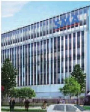
WILMOTTE ASSOCIÉS ARCHITECTES