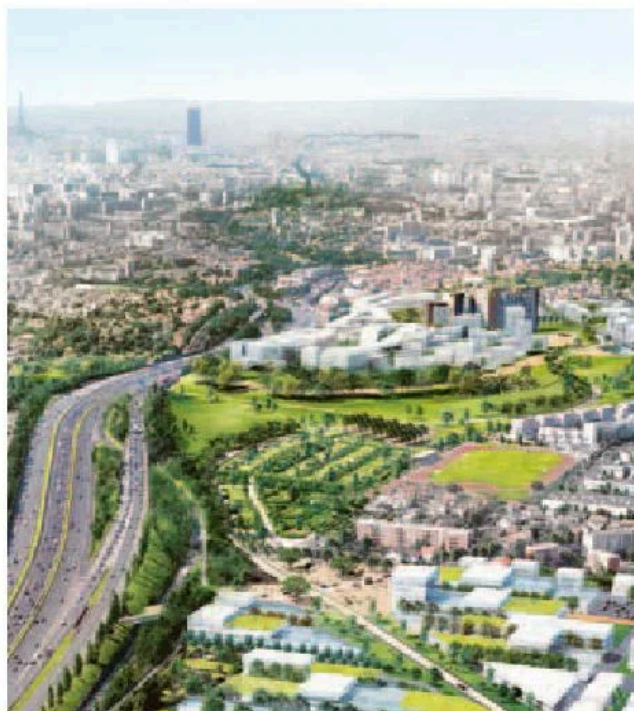
Une OIN est envisagée pour le projet Campus Grand Parc à Villejuif.

Prêts étendus. Tous ces territoires, qu'ils fassent ou non l'objet d'une OIN, s'accompagneront d'un contrat d'intérêt national (CIN). Le gouvernement a repris l'une des propositions du rapport Lajoie, sur la préfiguration de Grand Paris Aménagement. « La complexité de certaines opérations d'aménagement nécessite un partenariat renforcé entre les pouvoirs publics et les acteurs économiques, publics et privés, directement concernés », fait valoir le gouvernement. Ces contrats, « qui seront signés dans les six mois à venir détailleront les gouvernances, les procédures, les outils de l'Etat et de ses opérateurs », a précisé le Premier ministre. Les territoires en CIN et OIN pourront, par ailleurs, bénéficier d'une extension des prêts Gaïa de la Caisse des dépôts, « l'une des mesures les plus fortes de ce CIM », selon le préfet de région, Jean-François Carenco. Ces prêts permettront de financer des logements mais aussi des équipements et des infrastructures primaires. ● Nathalie Moutarde