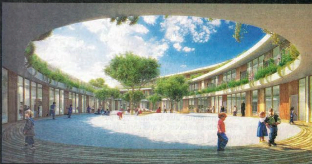
Protecteur, le bâtiment s'enroule autour d'une grande cour intérieure, orientée au sud et destinée aux élèves de maternelle, et protège ainsi l'intimité des enfants.