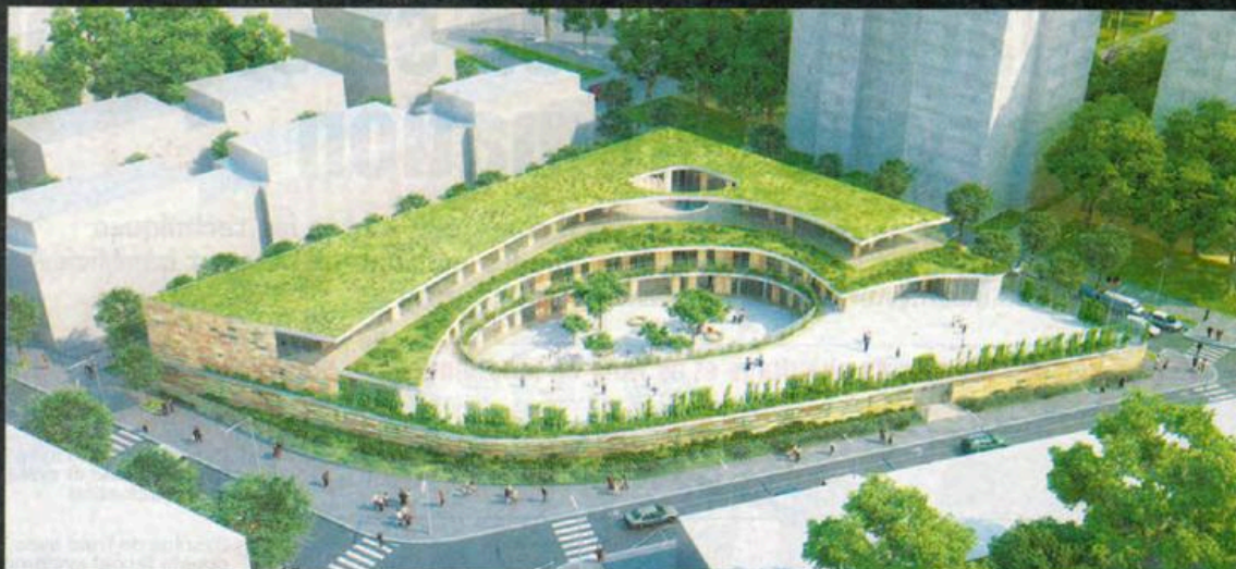
La nouvelle école constitue un équipement remarquable, visible par toutes ses façades, ainsi que par sa toiture, élément fondateur du projet sur lequel s'orientent les ouvertures des logements avoisinants.

Emblématique du renouvellement urbain du centre-ville, le projet a été conçu comme un repère architectural fort, convivial et accessible pour toutes les fonctions mutualisables. Vu de haut, le bâtiment se lit comme une succession de terrasses plantées qui s'ouvrent et s'enroulent en spirale sur le vide de la cour maternelle au rez-de-chaussée et sur la cour élémentaire située en terrasse (R+1). Cette configuration permet de proposer un bâtiment à la fois unitaire et protecteur, parfaitement identifiable, qui épouse le tracé des trois rues qui le bordent avec une variation volumétrique permettant un jeu de transparences et de contrepoints visuels. La masse bâtie sur trois niveaux descend progressivement en gradins vers le sud pour permettre un ensoleillement optimal des cours de récréation.