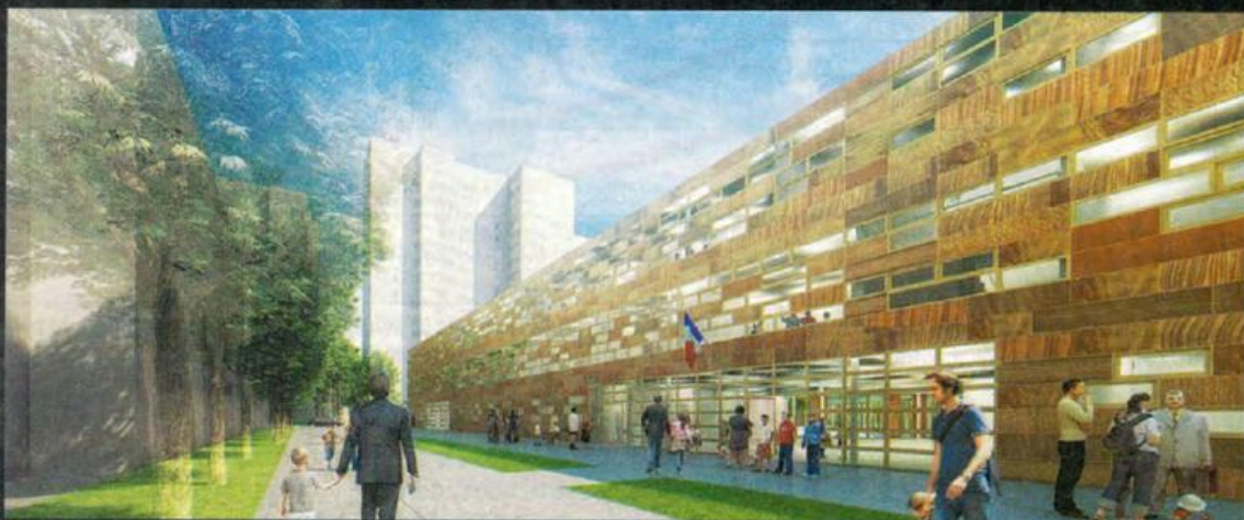
Sur la rue piétonne, la grande façade-mosaïque du bâtiment-paroi, animée par un jeu d'ouvertures aléatoires alternées avec des panneaux pleins en bois de différentes teintes, abrite l'entrée des écoles maternelle et élémentaire ainsi que l'entrée publique permettant l'accès aux centres de loisirs maternel et élémentaire, à la ludothèque et aux espaces communs.